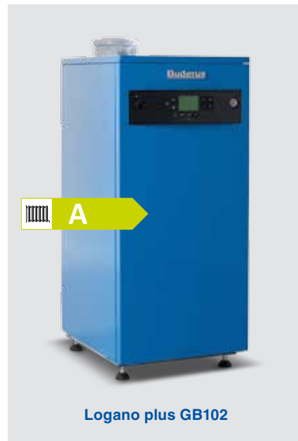
Logano plus GB102