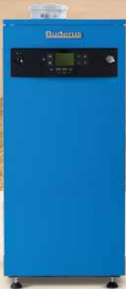
Logano plus GB102

Высокая эффективность в компактных размерах